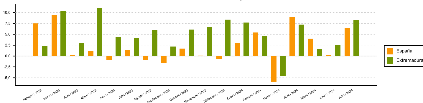
Variación anual del Índice de cifra de negocios. Servicios