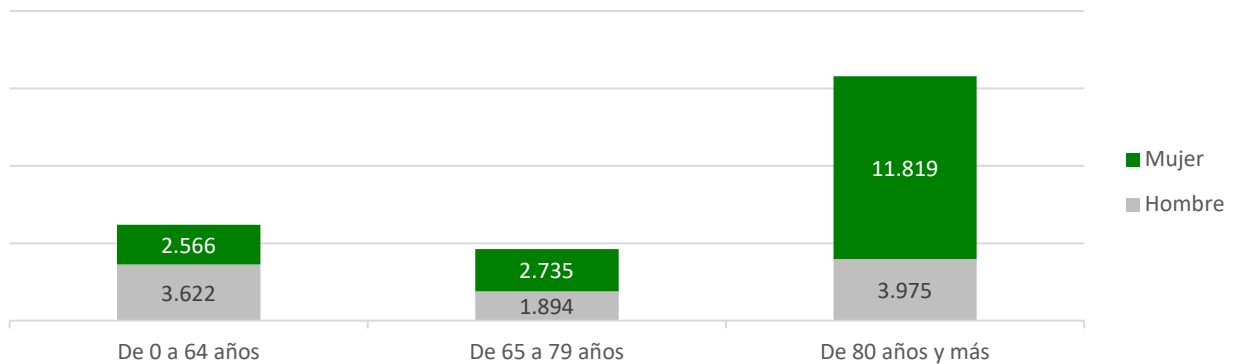
Resoluciones de Grado II y Grado III por sexo y tramos de edad. Extremadura