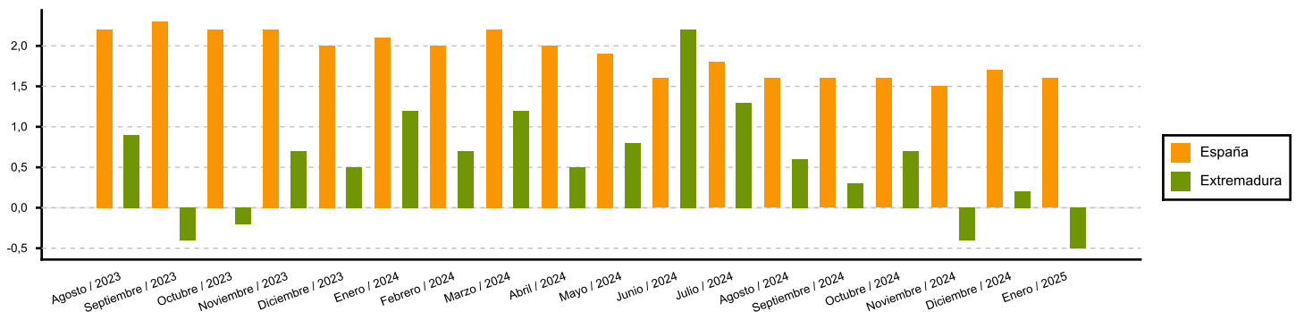
Variación anual del Índice de personal ocupado. Servicios