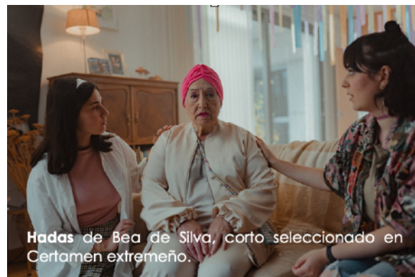
Hadas de Bea de Silva, corto seleccionado en Certamen extremeño.

En la sesión destinada a cortometrajes de Extremadura se podrá ver lo mejor de la producción extremeña del último año; cinco trabajos que muestran la buena salud del cine realizado por extremeños y extremeñas o por productoras de nuestra Comunidad, este año incluye una coproducción de animación con Portugal.