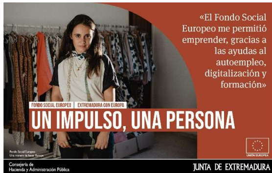
Anuncio en prensa

En el último trimestre del año hemos llevado a cabo una campaña de publicidad en TV, radio, prensa y RRSS de las actuaciones cofinanciadas por el Fondos Social Europeo y por el Fondo React-EU. El objetivo de esta campaña ha sido dar a conocer la importancia de todos estos mecanismos de financiación de la Unión Europea en Extremadura y